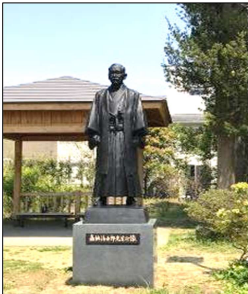
「嘉納治五郎先生の像」

《Cリーグ 野田むらさきの里Wと併せて複数認定》 主催/CWA 090-2405-8352(遠藤) 開催日/11月9日(土) 受付/我孫子駅南口東公園(JR 我孫子駅 3分) 9:15~9:30 出発式後団体歩行 参加費/一律 300円 解散/12時迄 北柏台公園(JR常磐線 北柏駅5分) コース/我孫子駅南口東公園~天神坂~手賀沼公園~嘉納後楽農園跡~船戸の森~北柏ふるさと公園~北柏台公園