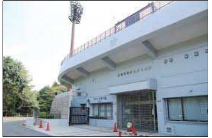
「岩名運動公園野球場」